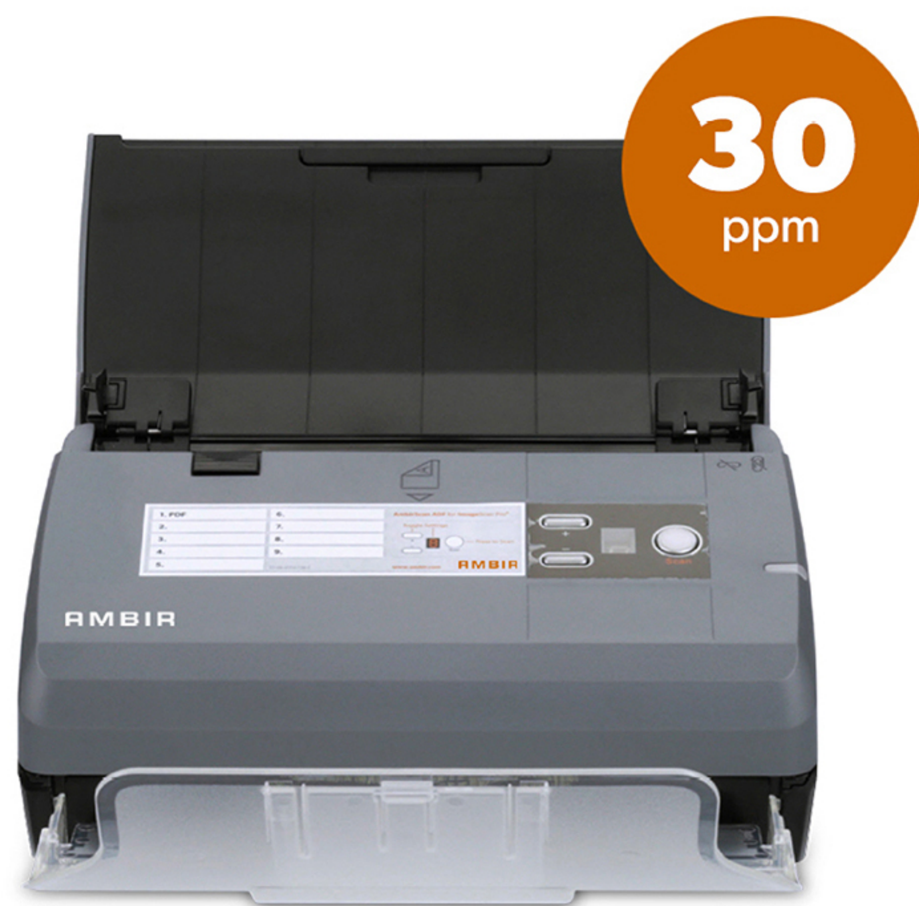
ImageScan Pro® 830ix Part Number # DS830IX-AS

Una opción inteligente para manejar más papeleo.