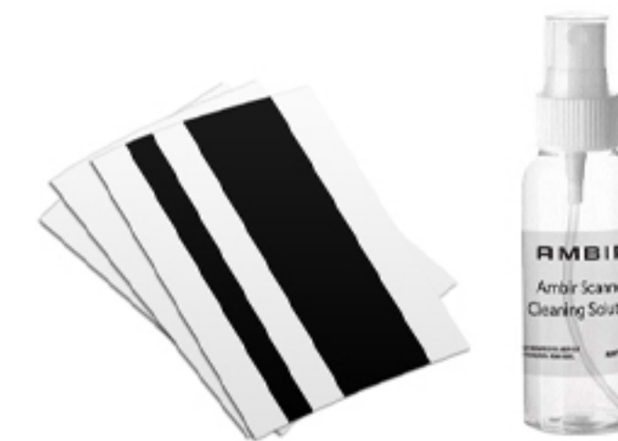
Kits de limpieza y calibración