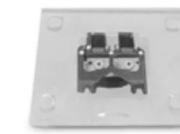
Almohadillas de alimentación ADF