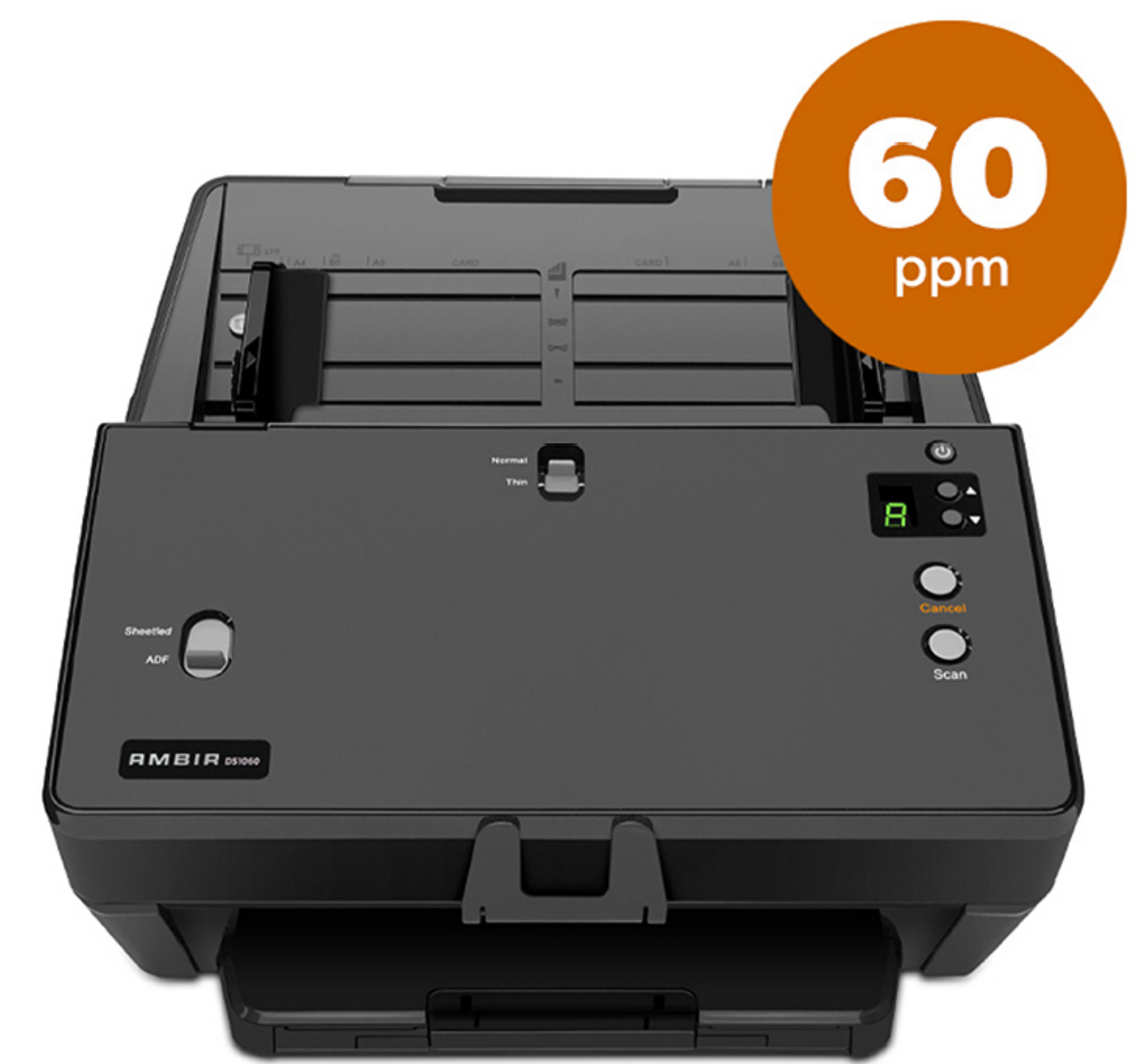
nScan® 1060 Part Number # DS1060-AS

Versátiles y potentes para enfrentar cualquier tarea; incluyendo pasaportes.