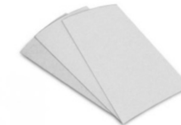
Hojas de limpieza