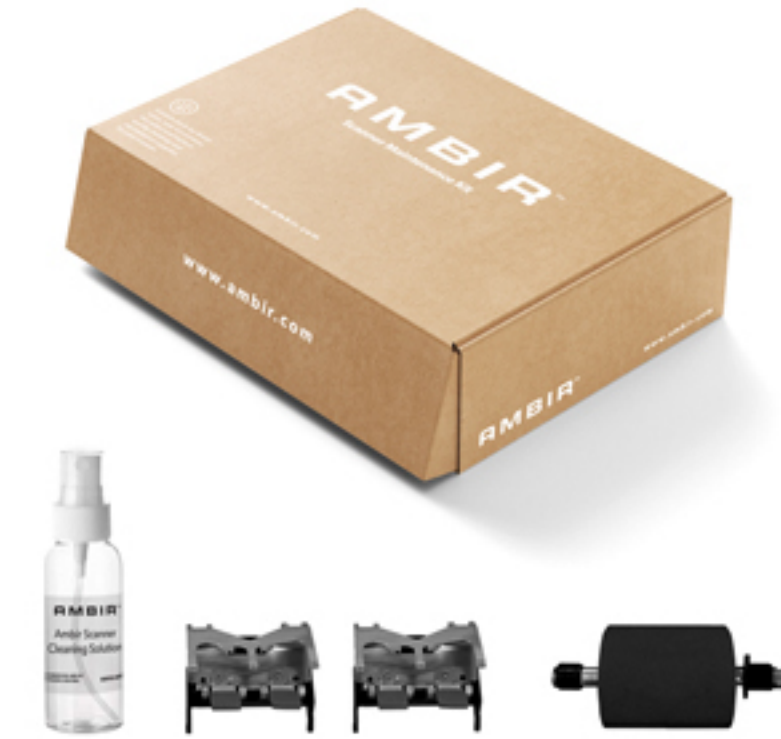
Kits de mantenimiento

Un buen escáner debe estar diseñado para durar en el tiempo y soportar un uso repetido. En AMBIR, creemos en crear soluciones asequibles que sean intuitivas de usar y fáciles de mantener. Al comprar AMBIR, obtienes más que solo un gran escáner. También obtienes un soporte integral por teléfono y chat en línea basado en EE. UU., garantías extendidas y consumibles diseñados específicamente para complementar tu dispositivo.