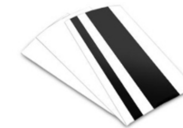
Hojas de calibración