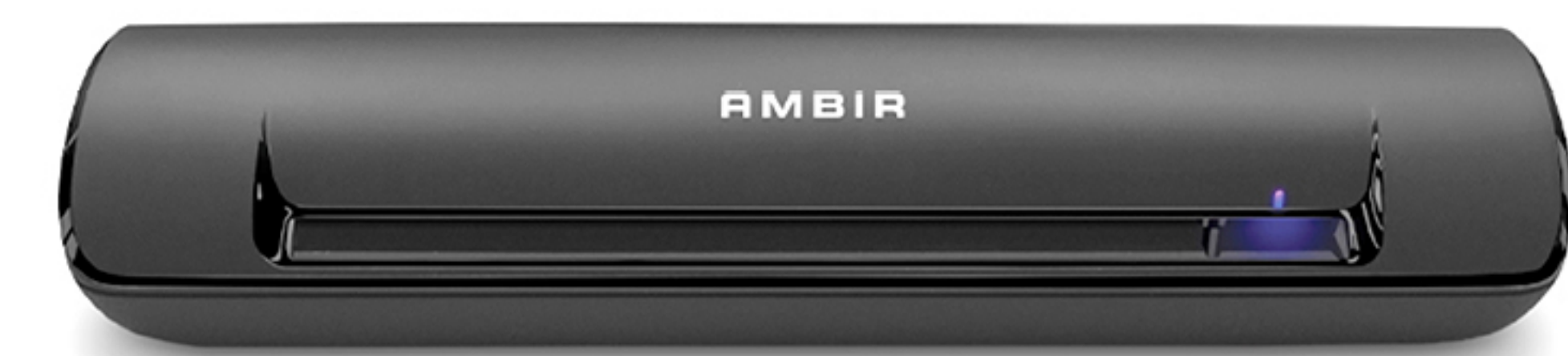
ImageScan Pro® 490i Part Number # DS490-AS

Manejan tarjetas y documentos con facilidad.