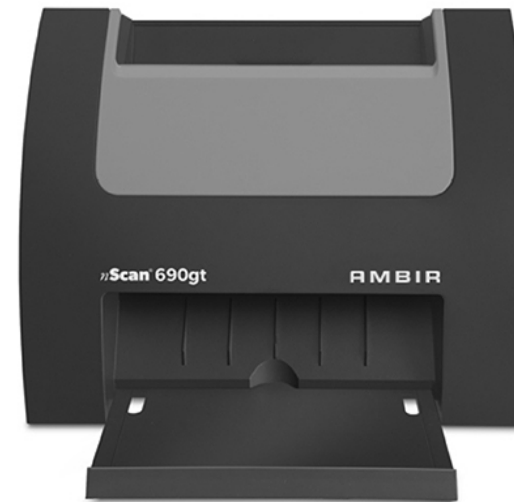
nScan™ 690gt Part Number # DS690-AS

Perfectos para escaneo exclusivo de tarjetas.