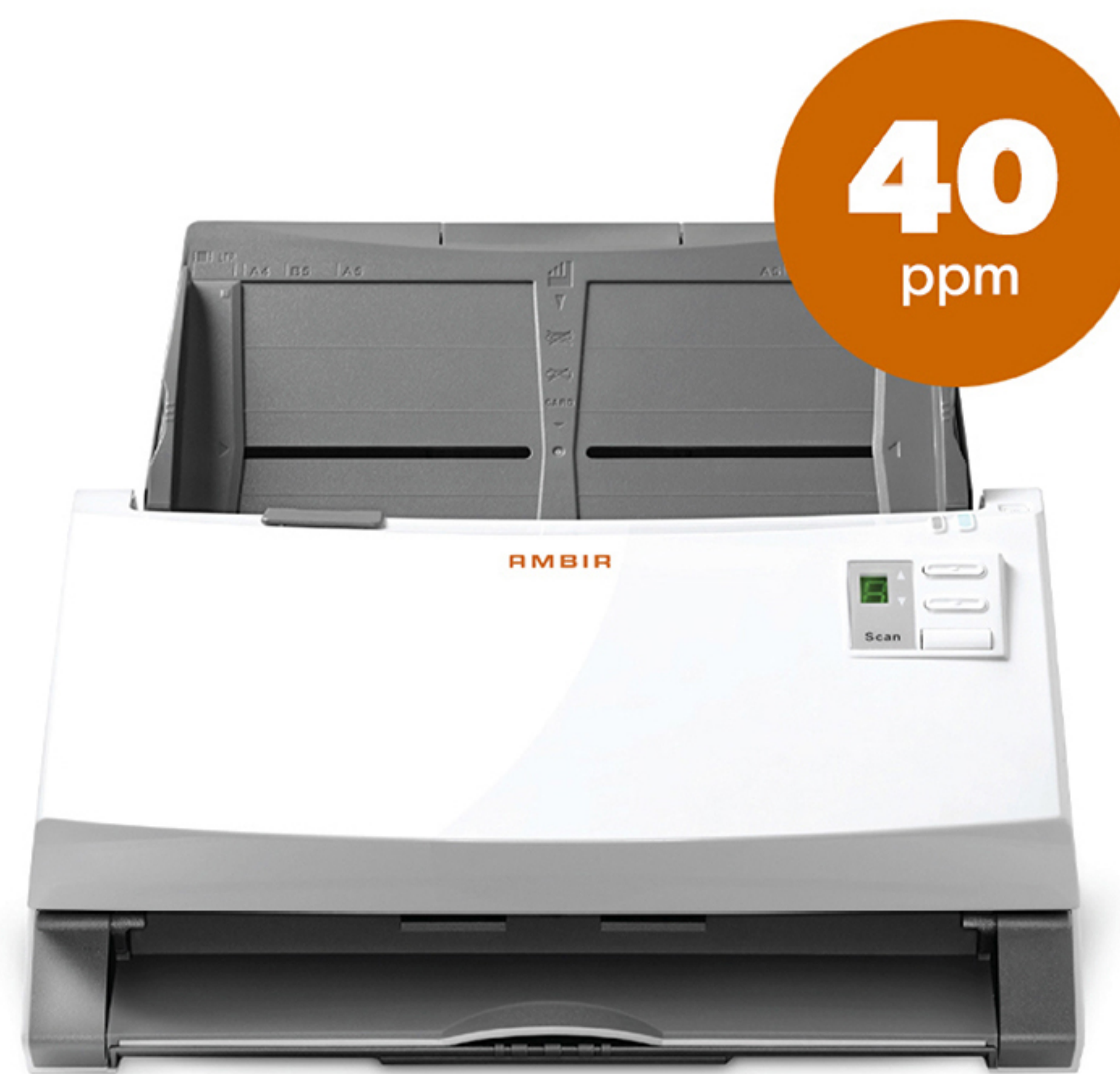
ImageScan Pro® 340 Part Number # DS340-SE

Diseñados para trabajos en volumen y flujos de trabajo intensos.